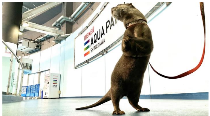
「コツメカワウソ ※イメージ」