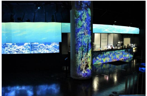
「コーラルカフェバー ※イメージ」

発光サンゴの水槽と、色鮮やかな海中を表現したデジタルアートが美しいカフェバーでは、館内で持ち歩きが可能なソフトドリンクやアルコール、軽食を提供しております。 イベントと連動したオリジナルの「シーズナルメニュー」には、桜のフレーバーや“和”を感じる抹茶を使用したドリンクやスイーツなど5種類のメニューをご用意しました。