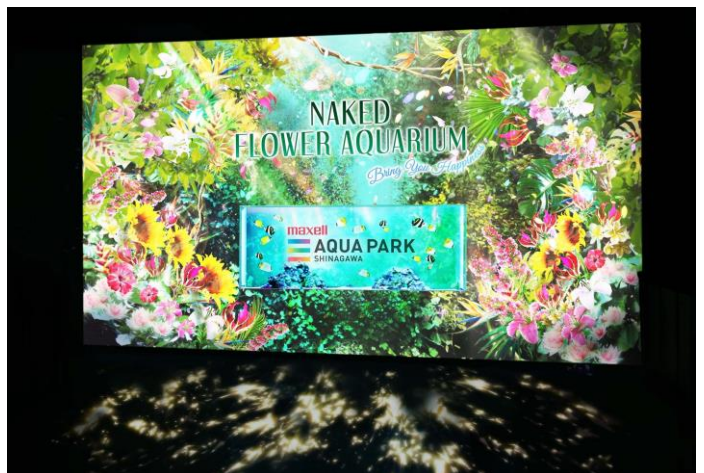
「Welcome Flower Gate ※イメージ」

色鮮やかなデジタルアートの花々と緑に覆われた、華やかなエントランス。中央の水槽には「トゲチョウチョウオ」や「ハタタダイ」がまるで“蝶”のように舞泳ぎ、ゲストの来訪を歓迎します。さらに、足元には木漏れ日の映像が優しく揺れ、体感的にお楽しみいただくことで、これから始まる「フラワーアクアリウム」への【ワクワク感(=期待感)】を高めます。