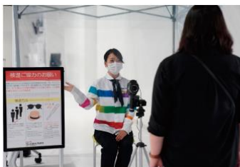
体温モニタリング