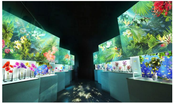
「Blooming Street ※イメージ」

花の造作と水槽が交互に並ぶ“アトリウム”のようなエリアです。壁や床にも映像演出が施され、空間全体で「フラワーアクアリウム」をお楽しみいただけます。こちらでは7つの水槽ごとに愛や幸せあふれる“花言葉”と、その植物の名前にちなんだ生きものを展示。例えば黄色の体色が鮮やかな“レモンテトラ”の水槽は、“誠実な愛”の花言葉を持つレモンの花の装飾とともに楽しめます。1つ1つをのぞき込みながら言葉にふれていただくことで、ゲストに【前向きな気持ち】をもたらします。