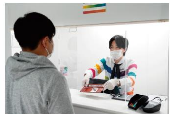
アクリルパネルの設置