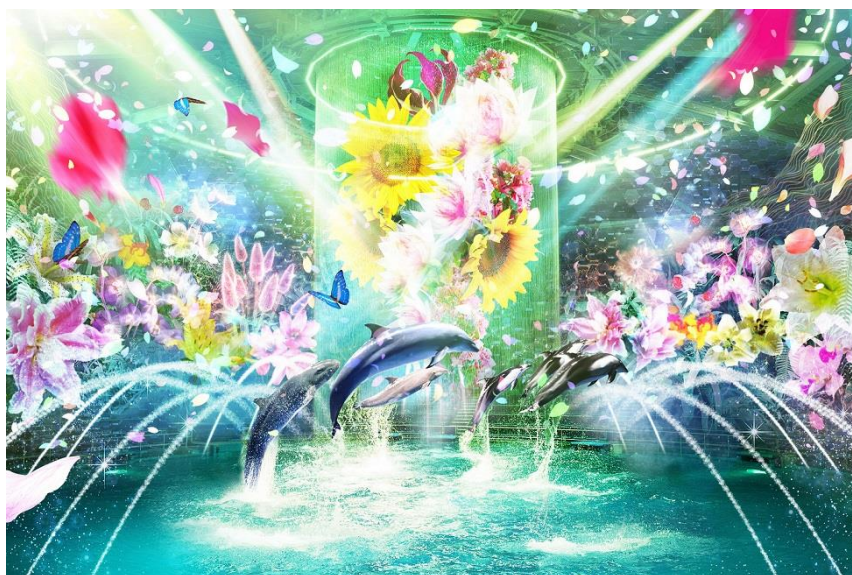
「Beauty of Flower ※イメージ」

【4月24日(土)～6月27日(日)※5月1日(土)～5日(水・祝)を除く】19:00 ※6月13日(日)は貸し切り営業のため、実施いたしません。 【5月1日(土)～5日(水・祝)】19:30