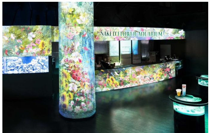
「Floral Cafe Bar ※イメージ」

海中に咲く「花」のような発光サンゴの水槽と、色彩豊かな映像の「花」が共演する美しいカフェバーでは、イベントと連動したオリジナルメニューをご用意しています。初夏の爽やかさや植物の色合いをイメージし、可憐な花々の名前がついたドリンクとスイーツは全部で5種類。なお、ご購入いただいた商品は館内での持ち歩きも可能です。