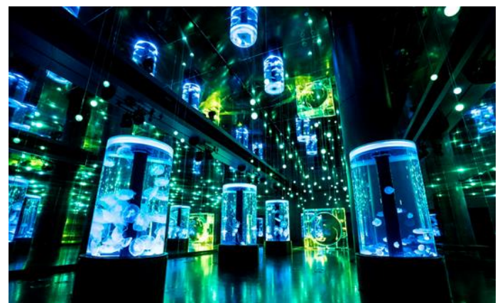
「ジェリーフィッシュランブル ※イメージ」

7つの円柱水槽と全面がクリスタルのシンボリックな水槽が並ぶ、クラゲ展示の大空間。生きものの魅力を引き立てる水槽照明と、98個のLEDライトが音楽に連動して輝き、鏡面になっている天井や両壁に反射して無数の光がエリア全体に広がります。今回は晴れ渡る初夏の空や、新緑をイメージしたブルーとグリーンが基調のライティングで3分毎に季節演出を開催。うっとり【恍惚感】を感じる、幻想的な光景がお楽しみいただけます。