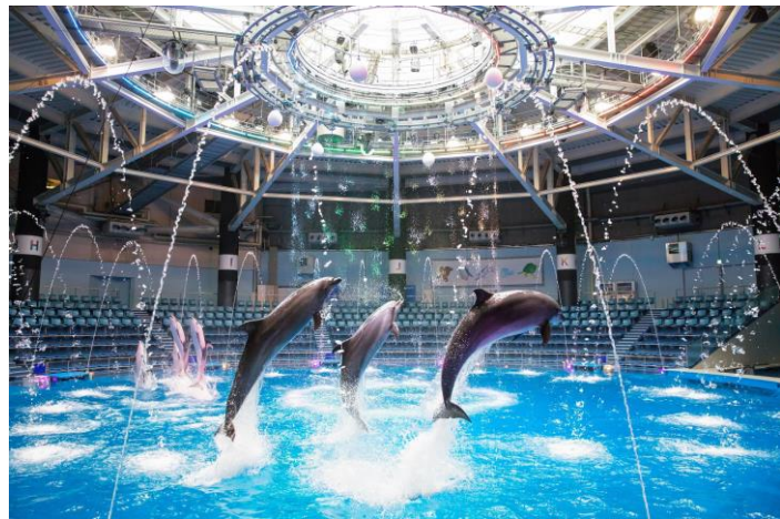
「Sky Symphony ※イメージ」

さらに、プログラム構成には“新しい生活様式”からヒントを得た2つのノンバーバル要素「①サイレントタイム」「②ゲスト参加型」を織り込み、MCや楽曲を入れない無音の空間で感じるイルカたちの“躍動感”や、会場一体となって盛りあがる演出で、ゲストに【熱い興奮】を感じていただけるパフォーマンスが完成しました。