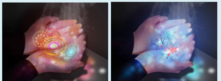
「NAKED花火つくばい ※イメージ」

古くからの日本文化である、茶室に入る前に手を清めるための蹲(つくばい)をモチーフに、手指のアルコール消毒をネイキッドがアート化した「NAKEDつくばい™」。手を入れると、アルコールとともに、手のひらにプロジェクションマッピングが現れます。今回は、花火と金魚を描いた全3種類の映像がランダムに投影される「花火アクアリウム」仕様でお楽しみいただけます。