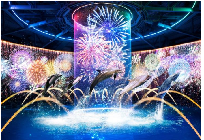
「瑠璃花火 ※イメージ」

「花火アクアリウム」のラストを飾る本プログラムは、MCを入れずに【水(噴水、ウォーターカーテン)】・【光(ムービングライト、水中照明)】・【映像(プロジェクションマッピング)】・【音(12.1chサラウンド)】の最先端テクノロジーを用いた演出のみで展開します。美しいデジタル花火が会場全体をつつみ込み、イルカたちの華麗なパフォーマンスと融合することで、ゲストを情緒的な夏の夜へと誘います。