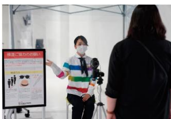
体温モニタリング