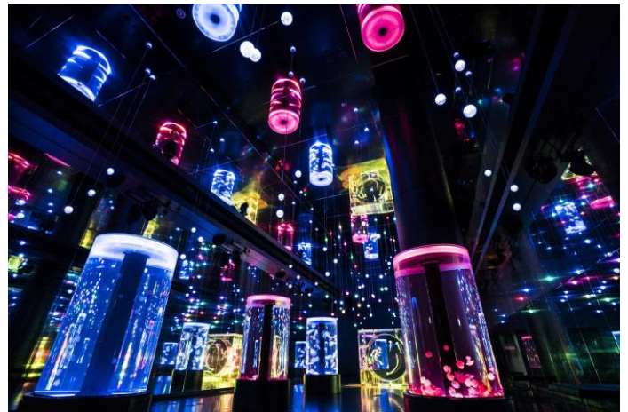
「ジェリーフィッシュランブル ※イメージ」

幅約9m×奥行約35mにもおよぶ、クラゲ展示の大空間。7つの円柱水槽と全面がクリスタルのシンボリックな水槽が並び、優雅に漂うクラゲたちをご覧ください。フロアの天井と両壁が鏡面になっており、98個のLEDライトと水槽照明が反射することで無数の光が広がる幻想的な空間を創出。なお、3分毎に開催される季節演出(約5分間)では、花火や縁日の会場をイメージした楽しい音楽と艶やかなライティングを用いて生きものの魅力を引き立てます。