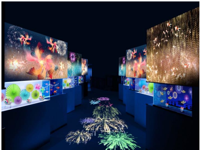
「祭り花火 ※イメージ」

7つの小水槽とショーケースが交互に並ぶこちらのエリアでは、それぞれの水槽を“屋台”に見立てた展示を行います。例えば、射的をイメージした水槽には的や駄菓子の装飾とともに、エサを“打ち落とす”生態が特徴的なテッポウウオがご覧いただけます。ゲストは壁面や床に打ち上がる鮮やかなデジタル花火につつまれて、小さな“屋台巡り”をお楽しみいただけます。