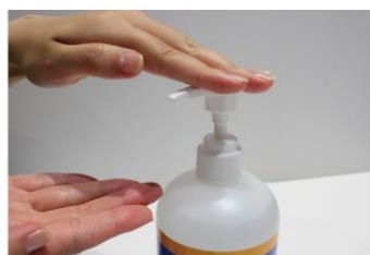
アルコール消毒液の設置