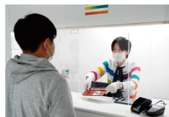
アクリルパネルの設置