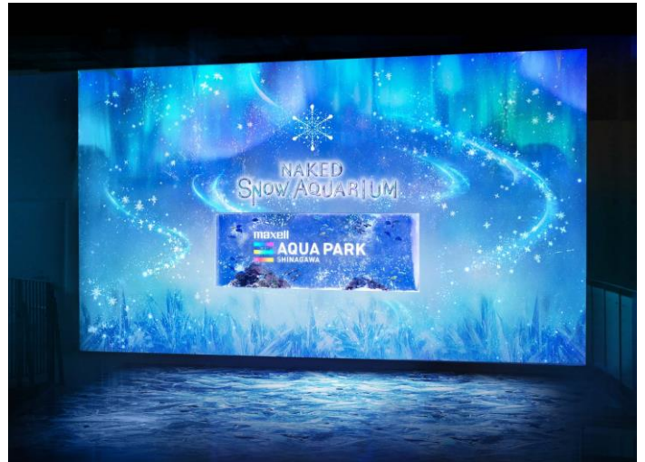
「BRIGHT SNOW ※イメージ」

見て、触れて“冬の美しさ”をご体感いただくことで入口からゲストを世界観へと深く引き込んでいきます。