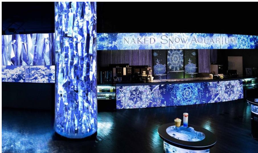
「CRYSTAL BAR ※イメージ」

発光サンゴの水槽が連なるムーディーなカフェバーは、氷やクリスタルの輝きをまとい、神秘的な空間へと姿を変えます。さらに数分に一度、映像のスノウフレークがエリア全体に舞い降りる様子をお楽しみいただける“スノウタイム”を設け、異なる2つの“冬の美しさ”でゲストを魅了します。メニューにも「スノウアクアリウム」の世界観をそのまま閉じ込めたような、アイスブルーやホワイトカラーのイベント限定ドリンクをご用意しております。