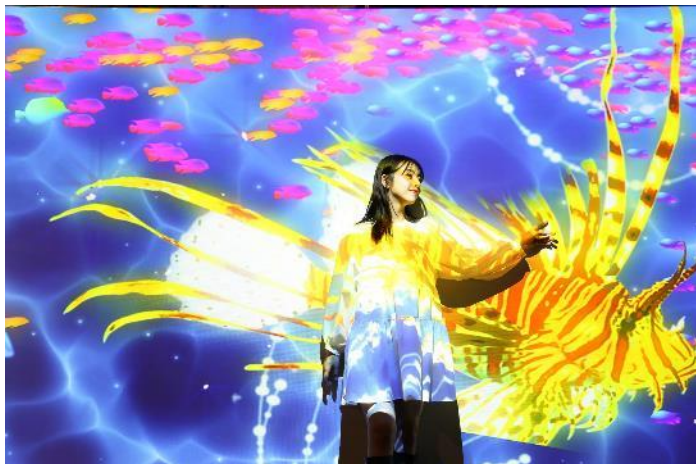
「ハナミノカサゴ ※イメージ」

パターンは全部で5種類。「ハナミノカサゴ」や「ユカタハタ」など、選りすぐりのファッションブルな魚たちを集めました。