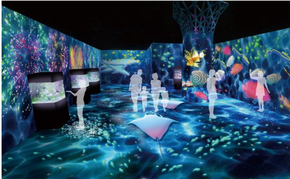
「UO FESTIVAL ※イメージ」

22台のプロジェクターを使用したダイナミックな映像演出とレイアウト変更可能な水槽の調和で、圧倒的な世界観への没入体験を提供するイマーシブエリア「パターズ」。今回は、魚たちが繰り広げる“海の世界のお祭り”をテーマに、賑やかで彩りあふれる空間を創出します。海中のシーンを描いた空間には、映像の水面が静かにゆらめき、カラフルな魚たちのシルエットが行き交います。さらに、1フロアで全く異なる2つの体感コンテンツをご用意しており、向かって左壁面には群れを成す魚たちの展示と映像がリンクして“花火”が打ちあがる「UO HANABI -魚花火-」を、右壁面では展示生物の模様やカラーを投影し、ゲストが身にまとうことができる「UO YUKATA -魚浴衣-」をお楽しみいただけます。また、数分間に一度、大輪のUO HANABIが空間を飾るショータイムも開催し、お祭りを盛りあげます。