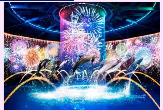
「瑠璃花火 ※イメージ」