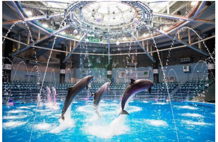
「WELCOME TO RYUGU FESTIVAL ※イメージ」

個性的なメロディーとテンポに合わせて、イルカたちが水中ダンスやダイナミックなジャンプを披露。さらに、その場でできる簡単な振り付けで会場一体となって盛りあがる“ゲスト参加型”の演出や豪快な水しぶきを堪能できる“スプラッシュ”も取り入れます。“RYUGU”の世界観をめぐる、同イベントのメインコンテンツとして愉快なひと時をお届けします。