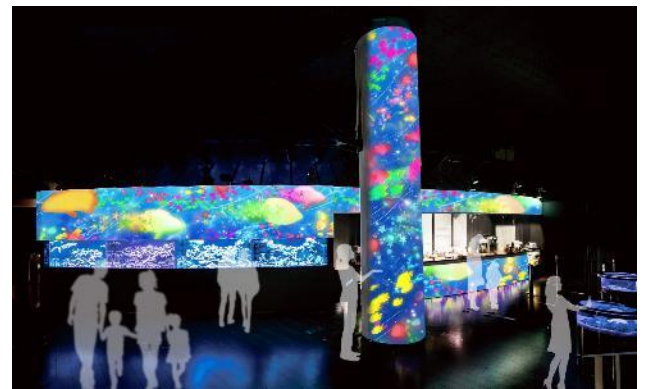
「RYUGU BAR ※イメージ」

さらにこちらでは、“RYUGU”の世界観をイメージしたカラフルな2種のクリームソーダやパフェなど、イベント限定メニューをご用意しました。展示生物と映像演出が織りなす美しい景色の中で、ドリンクを片手に非日常のひと時をお過ごしいただけます。