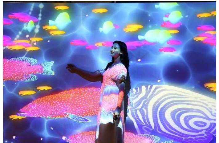
「ユカタハタ ※イメージ」