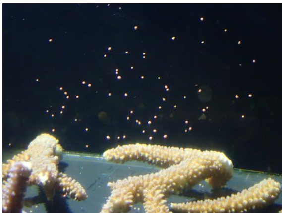
【幻想的なヤングミドリイシの産卵シーン】

将来的には“品川生まれ・品川育ち”のサンゴを、親サンゴのくらす八重山の海に返すことでサンゴ礁の再生に貢献することを目指します。今回の協定締結により連携をさらに強化していくことで、今まで知り得なかったサンゴの生態・魅力の発見に繋げていくとともに、多くの方に“海”について感じ、考える機会を発信してまいります。