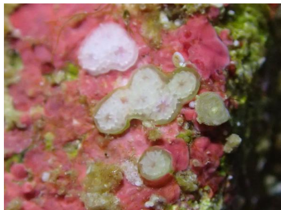
【着床し、変態したヤングミドリイシの“稚サンゴ”】