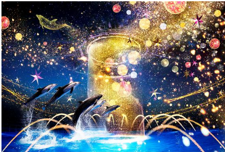
「Bright Christmas Party ※イメージ」

【水(噴水、ウォーターカーテン)】・【光(ムービングライト、水中照明)】・【映像(プロジェクションマッピング)】・【音(12. 1ch サラウンド)】などのデジタルテクノロジーを駆使し、圧倒的な世界観を紡ぎだします。