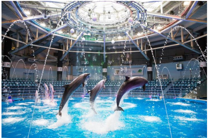
「Dolphin Decoration ※イメージ」

小麦をふるい、卵を割って、生地を混ぜる工程をパフォーマンスやスモークマシン、効果音などで演出。クリームのように甘く優雅な水中ダンスを用いてデコレーションの様子も表現します。ケーキが完成した後は、会場一体となって楽しむパーティータイムの幕開け！軽快なメロディーにのせたダイナミックなジャンプが続き、クリスマス気分を盛りあげます。