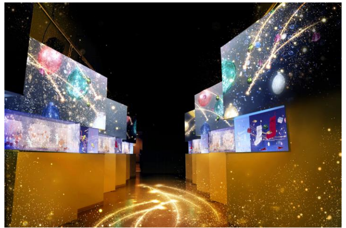
「Bright Sky Street ※イメージ」

【生きもの×映像演出×アートワーク】が創り出すアトリウムのような同エリアは、今季“クリスマスプレゼント”をテーマに展開。アートフラワーで飾ったショウケースと交互に並ぶ水槽には、おもちゃのような姿の「マンジュウイシモチ」とブロックで作ったクリスマスグッズ、「ユビワサンゴヤドカリ」とジュエリーなど7種類の展示がお楽しみいただけます。さらに、エリアの両壁と床面にはスターダストやクリスマスオーナメントの映像を投影。まるでクリスマスの夜、プレゼントBOXを開く瞬間のようなワクワク感をお届けします。