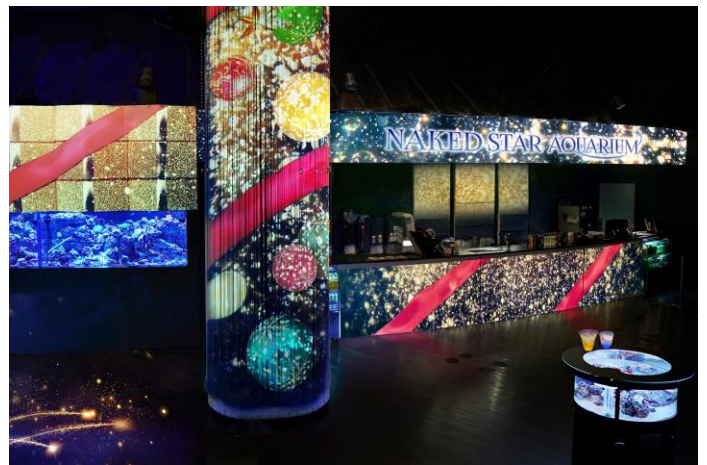
「Shiny Starry Bar ※イメージ」

発光サンゴの水槽が並ぶカフェバーは、真っ赤なりボンとオーナメントの映像でダイナミックに彩られ、クリスマスならではの心躍る空間へと姿を変えます。3分に一度、満天の星空につつまれるショータイムもあり、お好みのドリンクを片手にロマンチックな時間をお過ごしいただけます。今回の限定メニューには赤や白、ゴールドなどのグラデーションが美しいドリンクと寒い季節にぴったりなアップルシナモン風味のサンデーをご用意いたしました。