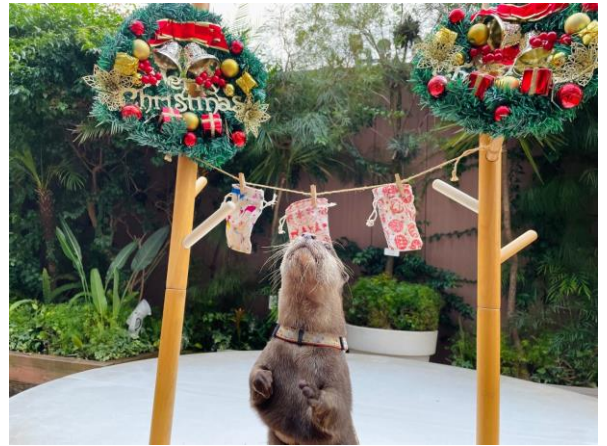
「ミニパフォーマンス(カワソウ)※イメージ」

当館唯一の屋外エリア「フレンドリースクエア」で開催される人気の生きものたちによるパフォーマンスです。アウトセイ・カワソウが時間ごとに登場し、各々の身体能力を披露。スタッフによる生態解説も行います。「スターアクアリウム」の開催に合わせ、同イベントでもツリーやプレゼントボックスなどクリスマスならではのアイテムとストーリーを取り入れ、季節感とともに生きものたちの魅力をたっぷりお届けしてまいります。