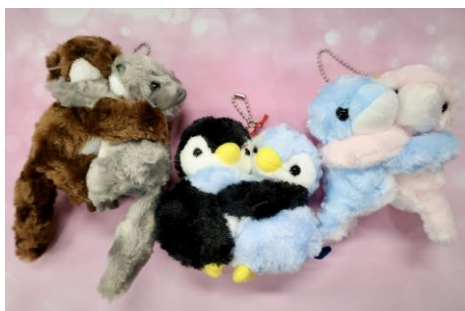
「①メチャラブ キーホルダー」

ソフトクッキーの中にチョコレートが入ったとろける食感のショコラ。当館の人気者“コツメカワウソ”をイメージしたキュートなパッケージに3本入っています。