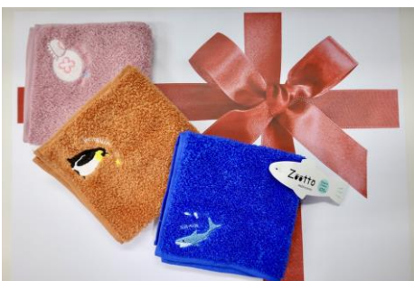
「②ワンポイント刺繍ハンカチ」