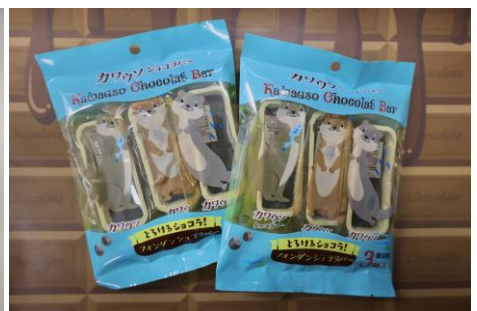
「③カワウソショコラバー」