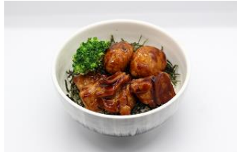
鶏肉の照り焼き2色丼 -味噌汁付き-