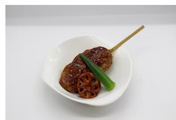
牛タン入りつくね焼き 400円

閉館後の水族館の観覧とお食事をセットにしたプラン。フードコートにてお食事を提供いたしますので、生きものの様子をご覧いただきながら、夜の水族館を思う存分お楽しみいただけます。夕方以降の活動先として是非ともご検討ください。