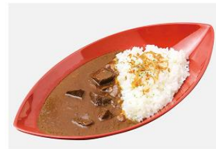
牛タンカレー -味噌汁付き-