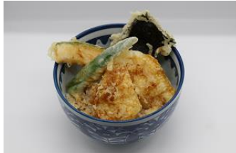
杜のふかフカ天丼 -味噌汁付き-