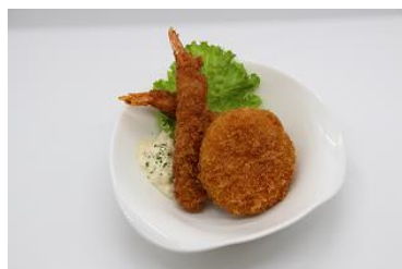
エビフライ&クリーミーコロケ 500円