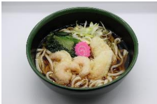
笹かまと小海老の天ぷらうどん